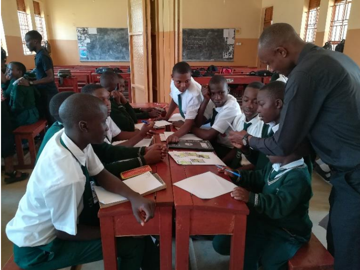
Die Spannung steigt: Was dieses Mal wohl auf der Ereigniskarte steht?

Während die Jugendlichen zu Beginn noch etwas unsicher scheinen, sind spätestens ab Runde zwei alle mit Feuereifer dabei. Wie ärgerlich – bei der Gruppe „Berlin“ sind alle Schweine an der afrikanischen Schweinepest gestorben – soll nun ein Kredit aufgenommen werden? Und wie funktioniert das mit der Tilgung eines Kredits eigentlich genau? Die Gruppe „Manila“ ist dagegen recht zuversichtlich, denn die letzte Ernte war überdurchschnittlich gut und sie haben Gewinn gemacht. Sollen sie nun investieren oder Geld sparen?