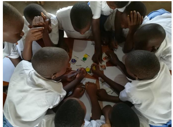
Es ist wie im richtigen Leben: Nie ist genug Geld da, um alle Wünsche zu erfüllen ...