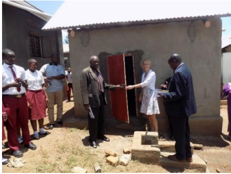
Eröffnung der Wasserversorgung an der St. Anthony Schule Kyazanga