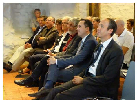
Die Auftaktveranstaltung in Weilheim an der Teck war gut besucht