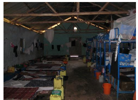
In dieser Unterkunft sind die Mädchen provisorisch untergebracht.