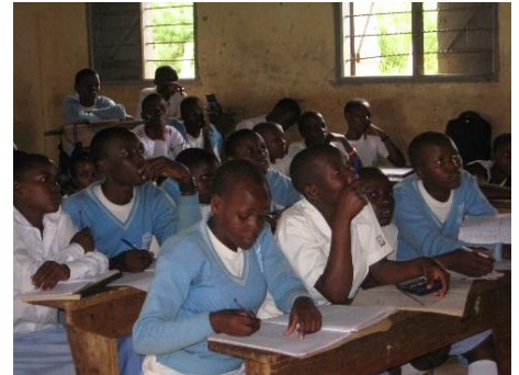
Schüler und Schülerinnen an der St. Mugagga Schule Kkindu

IBAN: DE55 6115 0020 0102 7700 63 BIC: ESSLDE 66XXX