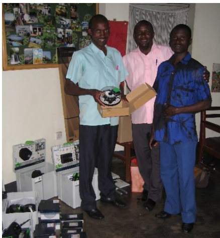
Große Freude herrscht am Berufsschulzentrum über die neuen Geräte

„Water is life“ – deshalb achtet ADEPT e.V. immer zuerst auf die Wasserversorgung an einer Schule. Erst wenn die Schule über genügend sauberes Trinkwasser verfügt, werden weitere Projekte in Angriff genommen. An zwei der Schulen im ADEPT Programm war die Wasserversorgung mangelhaft. Deshalb erhielt die St. Joseph Sekundarschule Butenga vier Wassertanks à 10.000 Liter, einen Wasserfilter und ein System für Wasserdruck. Dieses Projekt wurde unter anderem durch die finanzielle Unterstützung der Ein-Zehntel-Stiftung ermöglicht – herzlichen Dank! Für die St. Anthony Schule Kyazanga schaffte ADEPT e.V. drei Tanks à 10.000 Liter an, so dass nun auch dort die Wasserversorgung sichergestellt ist.