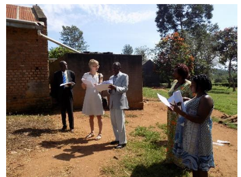
Vor Ort werden die Schulen für das ADEPT Programm ausgewählt