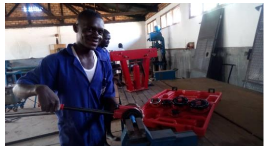
Mit den neuen Maschinen macht die Ausbildung deutlich mehr Freude

Ein zentrales Ziel von ADEPT e.V. ist es, die Berufsschulbildung in Uganda sowohl durch Know-How-Transfer als auch durch eine modernere Ausstattung der Lehrwerkstätten zu verbessern. Nachdem am Berufsschulzentrum in Butende die Klempner-Lehrwerkstatt in Eigenarbeit renoviert worden war, hat ADEPT e.V. diesen Fachbereich mit neuen Maschinen und Einrichtungen ausgestattet.