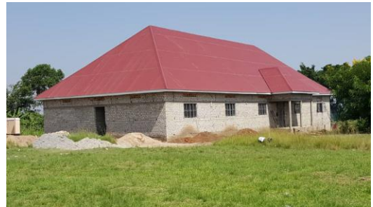
Die Schülerinnen freuen sich, dass sie das neue Internat dieses Jahr beziehen können

Der Bau des Mädcheninternates an der St. Mugagga Schule Kkindu kommt planmäßig voran. Nachdem der Dachstuhl fertiggestellt wurde, wird nun verputzt und der Innenausbau vorangetrieben. Die Schülerinnen freuen sich schon sehr darauf, bald in das Internat einzuziehen zu können.